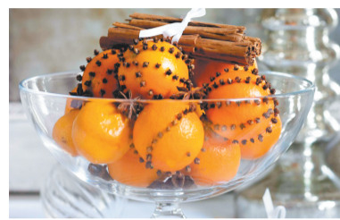
Новый год не за горами!