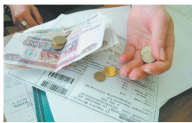
Оплата за коммунальные услуги