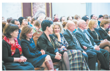
Конкурс педагогических достижений